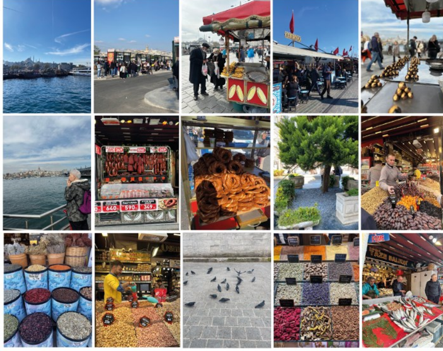
Resim 4.1. Çalışma Alanından Koku Manzaraları Görselleri

Yürütülen saha çalışması 15-65 yaş arasında çalışma alanında bulunan ve çalışmaya katılmak için gönüllü olan kadın ve erkek gönüllü 20 katılımcı ile gerçekleştirilmiştir. Katılımcılar bölgede çalışan, alışveriş için gelen veya orayı aktarma yapmak için kullanan insanlar arasından rastgele seçilmiştir. Herhangi bir koku kaybı problemi yaşamayan ve belirlenecek olan rotada katılımcıların yorulmaması ve sıkılmaması adına yaklaşık 30 dakika olarak belirlenen sürede yürüyebilecek kadar sağlıklı gönüllülerle çalışma yapılmıştır. Çalışma başında katılımcılara hiçbir kişilik haklarının ihlal edilmeyeceği ve istedikleri zaman çalışmadan ayrılacaklarının taahhütü verilmiştir.