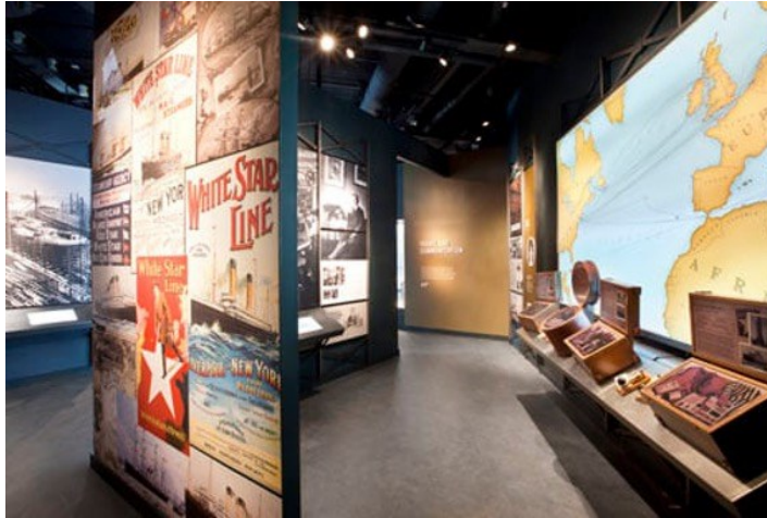
Şekil 3.2. Titanic Museum (Titanic Belfast, 2023).

Bu şekilde tasarlanan müzelerden biri 2012 yılında açılan, Kuzey İrlanda'daki Belfast kentinde bulunan Titanic Müzesi'dir (Titanic Museum, 2023). 14.000 metrekarelik alanda kurulu olan müzede interaktif galeriler, sergi alanları, konferans salonu gibi birçok bölüm bulunmaktadır (Titanic Museum, 2023). Müzede bulunan interaktif galeriler ziyaretçilerin gerçekten gemideymiş gibi hissetmesi için duyuşsal deneyimlerini güçlendirmek amacıyla geminin orijinalinde bulunan görseller, sesler ve kokularla tasarlanmıştır (Titanic Belfast, 2023) (Şekil 3.2). Yemek alanları, güverte, kontrol odaları gibi alanlar odak noktası olarak belirlenmiş ve bu sayede kokularla ziyaretçilerin hafızasında daha iyi yer etmesi amaçlanmıştır (Titanic Belfast, 2023).