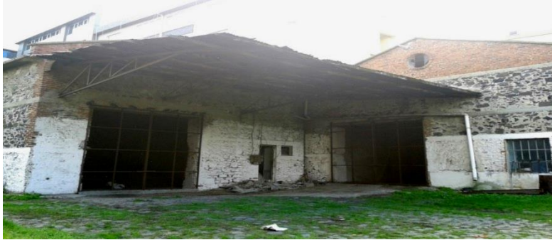
Şekil10.Kagir Yağ Fabrika Yapısı Ve Yuvarlak Pencereli Üçgen Tuğla Örgülü Alınlık

2011 tarihinde II grup eski eser olarak tescillenmiş olan yapı grubu için envanter kaydında; bakımdan sorumlu kuruluş Silivri Belediyesi ve öneri kullanım kültürel işlev olarak belirtilmiştir.Aynı karar ile 15 ada 60 sayılı parsel üzerinde yer alan yağ fabrikasına ait silindirik gövdeli fabrika bacası da tescil edilmiş olup, envanter kaydında tuğla malzeme ile yapılmış iyi durumdaki bacanın da özgün yapım tekniği ve malzemesi özgün durumunu koruduğu belirtilmiştir.