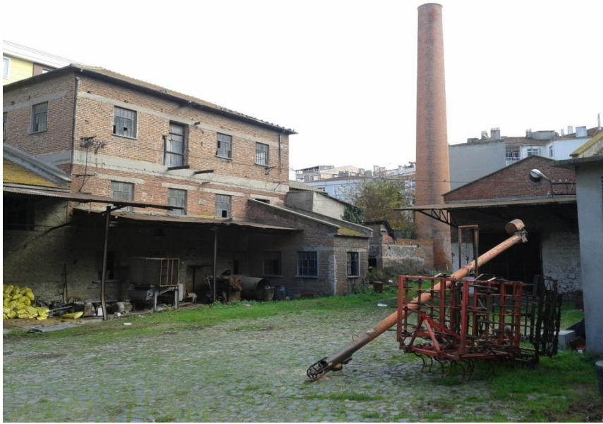
Şekil 8.Tuğla örmeli Fabrika Yapıları ve Bacası

Fabrika binası envanter kaydı ayrıntılı tanımlar kısmında; “Yığılma-moloz taş ve tuğla malzeme ile inşa edilen tek katlı kagir bina enine gelişen bir plan göstermektedir. Taş örgünün aralarında beton derzleme ile onarım yapılmıştır. Kısmen bina köşeleri ve pencere kenarları ile yuvarlak pencereli üçgen alınlık tuğla örgülüdür.Yapının cepheleri beton hatıllar ile üç bölüme ayrılmıştır.Zemin kat kısmen boyalıdır. İç mekan yığılma moloz taş olan yapının orijinal kullanım şekli yağ fabrikasıdır( İst.1 nolu K.T. V.K. Bölge Kurul 08.07.2011 tarihli kararı eki ).Aynı karar ile 15 ada 60 sayılı parsel üzerinde yer alan yağ fabrikasına ait silindirik gövdeli fabrika bacası tescil edilmiş olup, envanter kaydında tuğla malzeme ile yapılmış iyi durumdaki bacanın da özgün yapım tekniği ve malzemesinin özgün durumunun koruduğu belirtilmiştir.