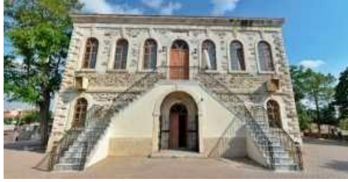
Şekil 4.Germiyan Kilisesi

Silivri Selimpaşa'da bulunan Aya Yorgi Kilisesi de günümüzde cami olarak kullanılmaktadır. 1 nolu KVKB Kurulu Arşivi anıt fişine göre, 19. yüzyılın son çeyreği veya 20. yüzyılın ilk çeyreği başlarına tarihlenmektedir(Küçük,ve Eyüpgiller,2018). Silivri ilçe sınırında yer alan kiliselerden biri de Seymen köyünde yer almaktadır.Kilisenin üzerindeki levhada Eksarhia Bulgar Ortodoks Kilisesi olduğu ve 19. yüzyılın ikinci yarısı sonrası köye göçmen olarak gelen Bulgarlar tarafından yapıldığı ileri sürülmektedir. Merkeze 6 km mesafede yer alan Ali Paşa Mahallesi sınırları içinde 1520 yıllardan sonra yapıldığı varsayılan Ali Paşa Camisinden ise günümüze sadece minarenin kalıntıları ulaşmıştır.