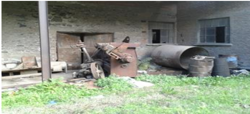
Şekil 9. Yağ Fabrika Bina Detayı Yapısı

Kısmen bina köşeleri ve pencere kenarları ile yuvarlak pencereli üçgen alınlık tuğla örgülüdür.Yapının cepheleri beton hatıllar ile üç bölüme ayrılmıştır.Zemin kat kısmen boyalıdır. İç