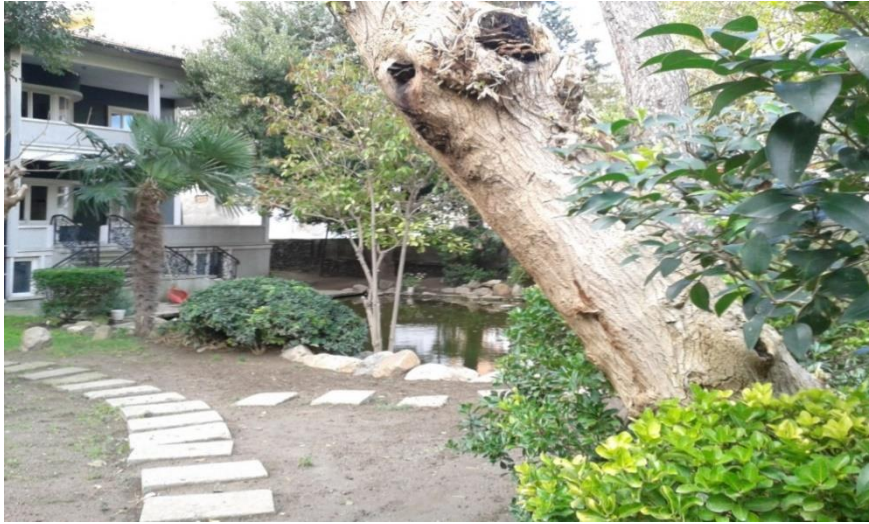
Şekil 13. 15 ada 60 parsel komşuluğunda bulunan Z+2 kat bahçeli konut yapısı