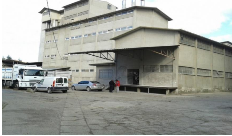
Şekil 12.Eski Yağ Fabrika Yapıları Komşuluğunda Fiilen İşlevini Devam Ettiren Varnalı Un Fabrikası