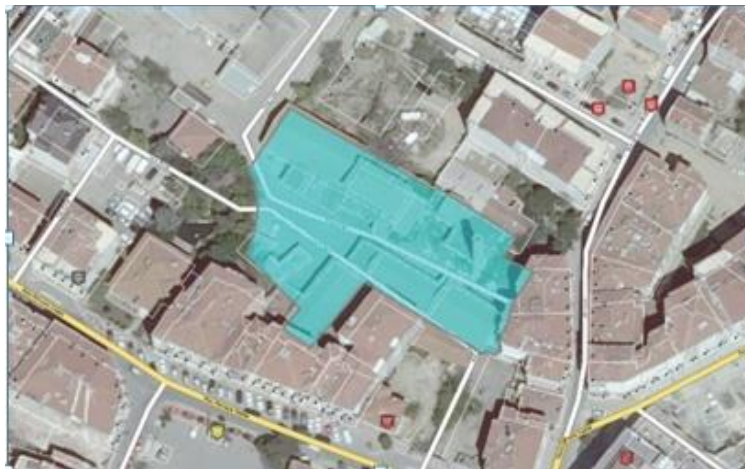
Őekil 7.İŐlev dıŐı kalmıŐ yaĐ fabrikasını kapsayan 15 ada 60 parsel ve yakın evresine ait ortofoto

Silivri kent merkezi,Piri Mehmet PaŐa Mahalle sınırları iinde yer alan 15 ada 60 parsel sayılı taŐınmaz ve  zerindeki yapılar İstanbul 1. nolu K lt r ve Tabiat Varlıklarını Koruma B lge Kurulu'nun 2863 Sayılı Kanun h k mleri doĐrultusunda 08.07.2011 tarihli kararı II.Grup Tescilli Eski Eser olarak kaydedilmiŐtir. Koruma kurulunun taŐınmaza ait envanterinde:“G n m zde kullanılmayan yapı str kt rel aıdan saĐlam olup,yapısal durumu, yapım tekniĐi, malzemesi ile  zg n durumunun korumaktadır.” Denilmekte ve yapım aĐı 20. y zyıl ortası olarak belirtilmiŐtir. YaĐ fabrikasının bulunduĐu alan yapılanmıŐ evre iinde kalmakla birlikte g n m zde de mahalle sınırları iinde verimli tarım arazileri bulunmaktadır. Silivri verimli tarım arazileri Trakya genelinde olduĐu  zere uzun s reler ayieĐi  retimi iinde yer almıŐlardır. Bu nedenle fabrikanın kuruluş yıllarında hem hammaddeye hem de merkezi fonksiyonlar yakın olacak Őekilde konumlanmıŐ olduĐu g r lmektedir.