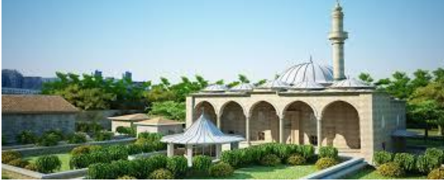
Şekil 3. https://www.silivriliyiz.com/silivri-tarihi-yerler-tarihi-mekanlar-

Kanuni Sultan Süleyman'ın Vezir-i azamı olan Piri Mehmet Paşa'nın İstanbul ve Silivri'deki Camii ve Külliyesinin bakımı ile ilgili vakıf, Bulgaristan-Varna şehrindeki Vakıflar arasında sayılmıştır(Gökbilgin'den1986,aktaran.KoyuncuKaya,2015)34