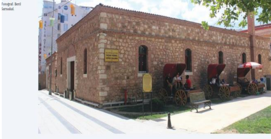
Şekl 6. K lt r Merkezi ve Sergi Salonu olarak iŐlev verilen YoĐurthane Sarısakal,( 2017,s.18)