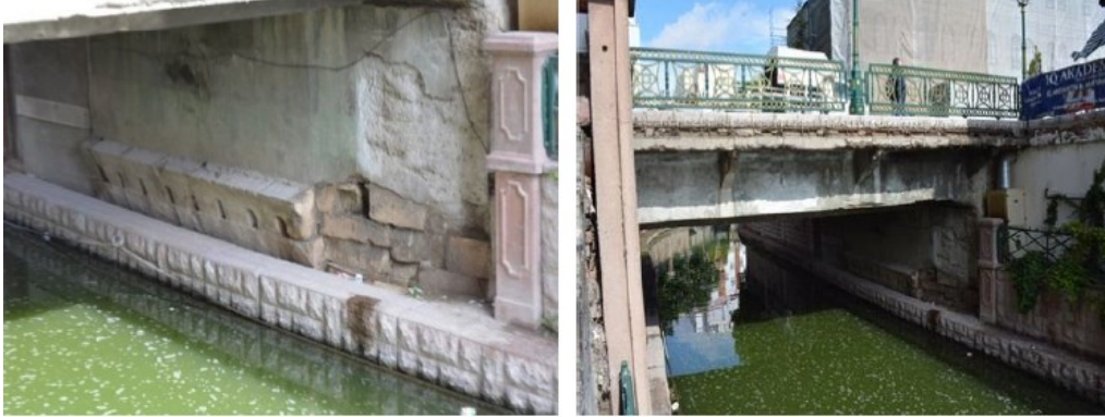
Şekil 4. Porsuk nehri yakınlarındaki sıcak sular bölgesinde bulunan Roma dönemine ait kalıntılar (Hakyemez, 2016)

önemini korumaya devam etmiştir. Ancak antik kaynaklarda kentin isminin çok fazla geçmediği görülmektedir. Bunun başlıca nedeninin kentin gelişmişlik açısından çevresindeki daha önemli kentler olan Kollossai, Ikonion, Peltai ve Kelainai'nin gölgesinde kalması olduğu düşünülmektedir (İzник, 2003) (Şekil 3).