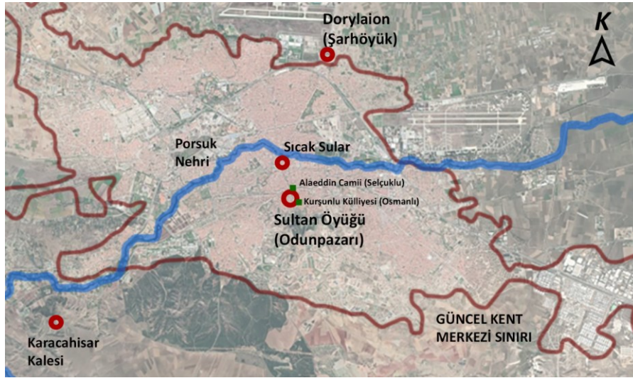
Şekil 6. Dorylaion'un yıkılmasının ardından kurulan Sultan Öyüğü'nün konumu ve çevresiyle ilişkisi.

Selçukluların kenti işgali sonrası yeni bir yerleşim olarak kurdukları Sultan Öyüğü, günümüzde Odunpazarı olarak bilinen ve Porsuk nehrinin güneyindeki tepelik bölgenin kuzey yamaçlarında kurulmuştur. Bizans İmparatorluğunu mağlup ederek bölgeye hakim olan Selçuklular, harabe halindeki Dorylaion ve Karacahisar yerine, Porsuk ve sıcak su kaynaklarına yakın, günümüzdeki kent merkezinin güneyinde yer alan tepelerin yamacına yerleşmiştir. Yeni yerleşim alanı Sultan Öyüğü olarak adlandırılmış ve günümüzdeki Eskişehir kent merkezinin oluşumunu etkileyerek, kentin yayılımının başladığı alan olmuştur. I. Alaeddin Keykubat tarafından yaptırılan ve günümüzde de ayakta olan Alaeddin Camii (1220), Selçukluların yerleşim yeri ve kentin yeni başlangıç bölgesinin bugünkü Odunpazarı bölgesi olduğunun göstergesidir (Şekil 6) (Ertin, 1994).