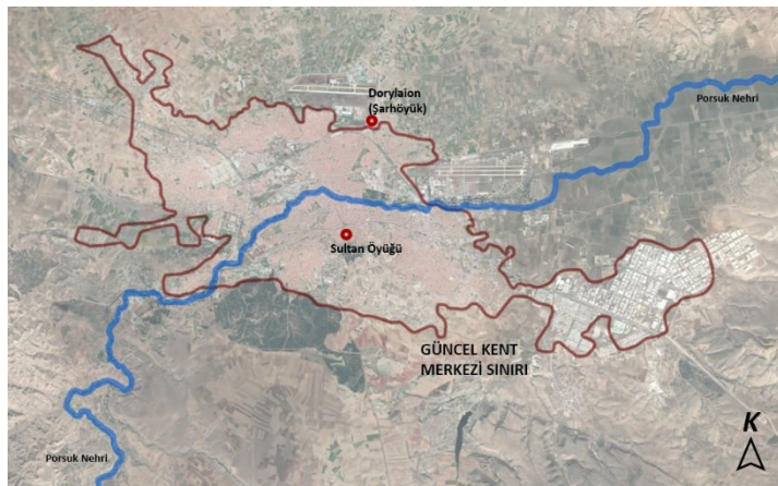
Şekil 1. Güncel Eskişehir kent sınırları içindeki Dorylaion ve Sultan Öyüğü yerleşim yerleri.

Eskişehir iki kere kurulmuş bir kenttir. Bu kuruluşun ilki erken tunç çağında başlayıp sonrasında Dorylaion olarak bilinen, günümüzde yok olmuş antik kent, ikincisi ise Selçukluların kurarak Osmanlı hakimiyetinde gelişimine devam ederek modern Türkiye devletindeki Eskişehir kentinin temellerini oluşturan Sultan Öyüğü'dür. Şekil 1'de Dorylaion ve Sultan Öyüğü yerleşimlerinin mevcut Eskişehir kentindeki konumları görülmektedir.